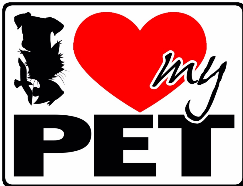
Figuur 3: I ❤️ my pet logo

Alle te nemen stappen ter uitvoering van dit programma moeten vergezeld gaan met de nodige informatie- en voorlichtingscampagnes hieromtrent. Dit moet een grote voortgaande campagne worden met het logo “I ❤️ my pet” dat als vast logo voor dit Nationaal Plan zal worden gebruikt.